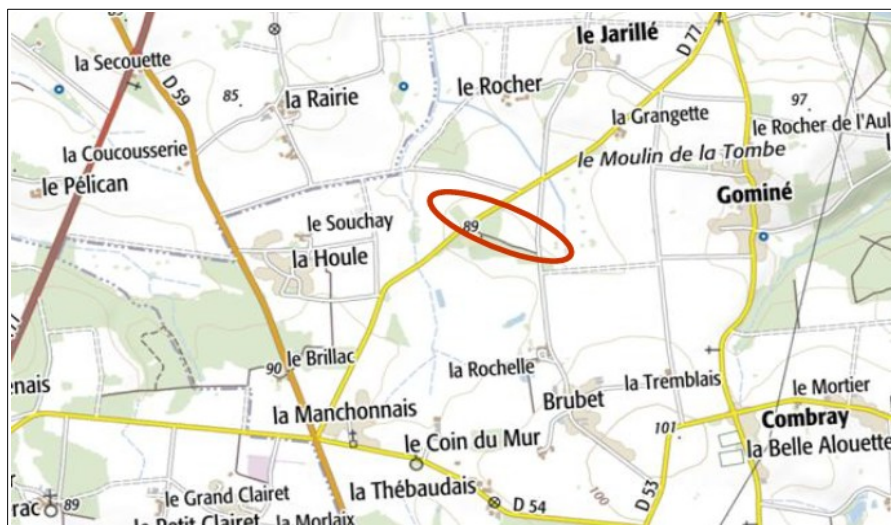
Carte du projet

Le projet est porté par l'investissement des citoyens, la commune de Saint Ganton, les associations Énergies Citoyennes en pays de Vilaine et Saint-Gant'éole Citoyen, Redon Agglomération, la société d'économie mixte breillienne (SEM) Energ'IV, la société ENERCOOP Bretagne et la société d'investissement Bretonne Eilañ.